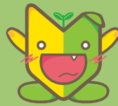
大学生協運転免許キャラクター「若葉マークくん」